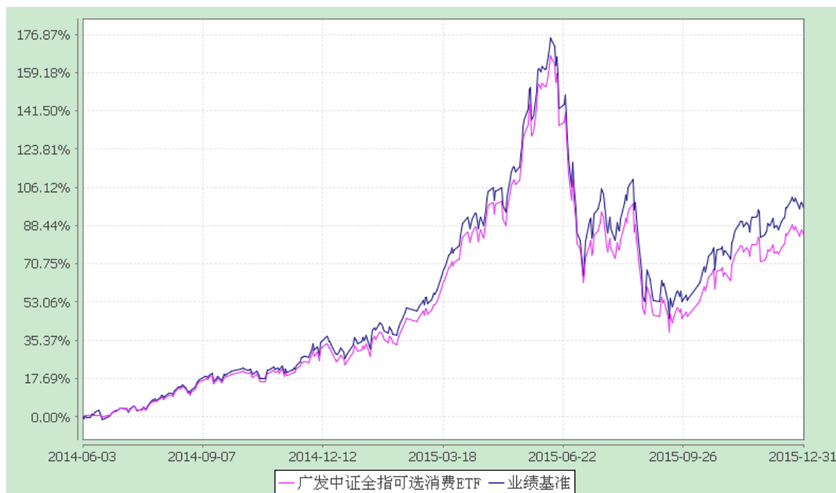
广发中证全指可选消费交易型开放式指数证券投资基金 份额累计净值增长率与业绩比较基准收益率的历史走势对比图 (2014年6月3日至2015年12月31日)