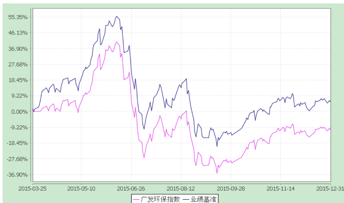
广发中证环保产业指数型发起式证券投资基金 份额累计净值增长率与业绩比较基准收益率的历史走势对比图 (2015 年 3 月 25 日至 2015 年 12 月 31 日)

注：1、本基金合同生效日期为 2015 年 3 月 25 日，只披露时点本基金成立未满一年。