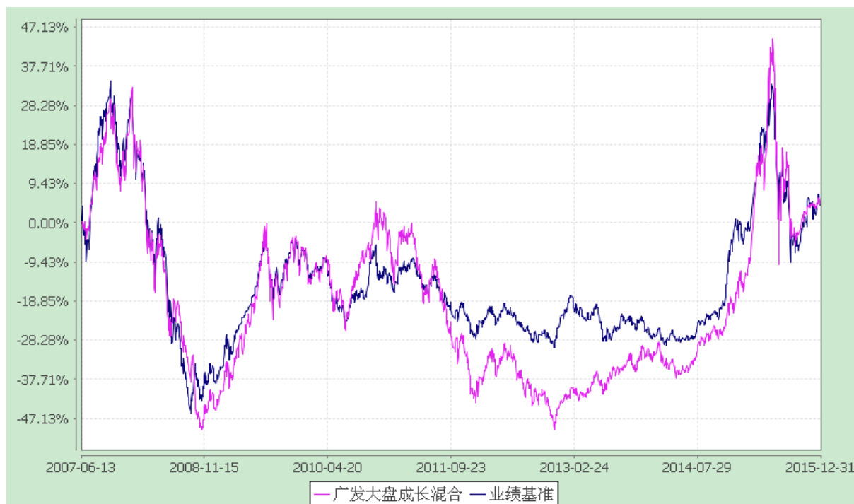
广发大盘成长混合型证券投资基金 份额累计净值增长率与业绩比较基准收益率的历史走势对比图 (2007 年 6 月 13 日至 2015 年 12 月 31 日)