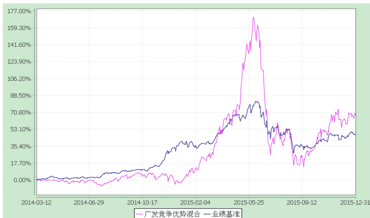
广发竞争优势灵活配置混合型证券投资基金 份额累计净值增长率与业绩比较基准收益率的历史走势对比图 (2014 年 3 月 12 日至 2015 年 12 月 31 日)