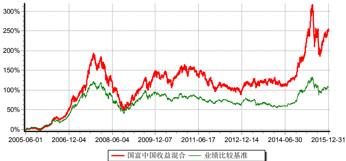
富兰克林国海中国收益证券投资基金 份额累计净值增长率与业绩比较基准收益率历史走势对比图 （2005年6月1日-2015年12月31日）

注：本基金的基金合同生效日为2005年6月1日。本基金在建仓期结束时，各项投资比例符合基金合同约定。