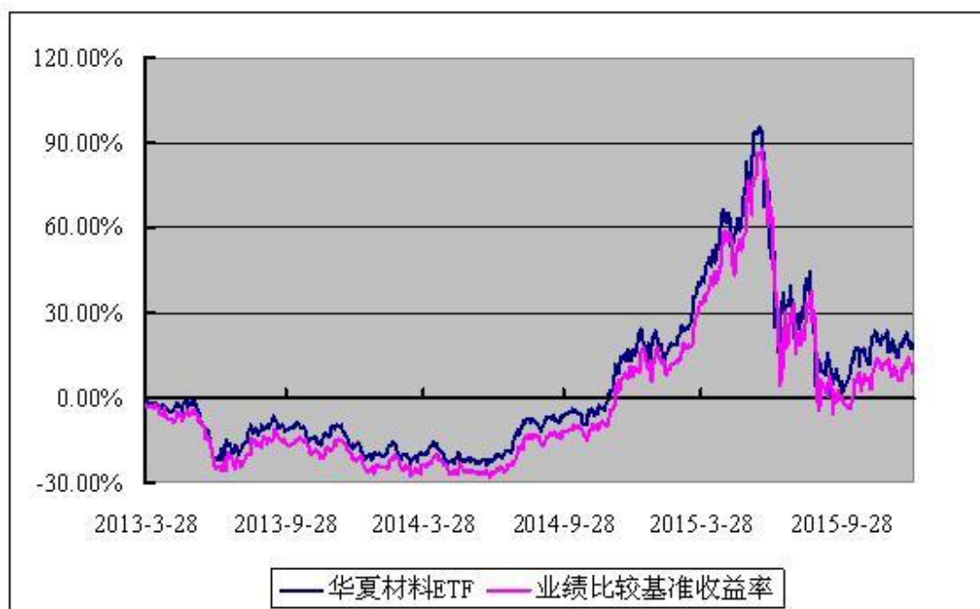
上证原材料交易型开放式指数发起式证券投资基金 份额累计净值增长率与业绩比较基准收益率历史走势对比图 (2013年3月28日至2015年12月31日)