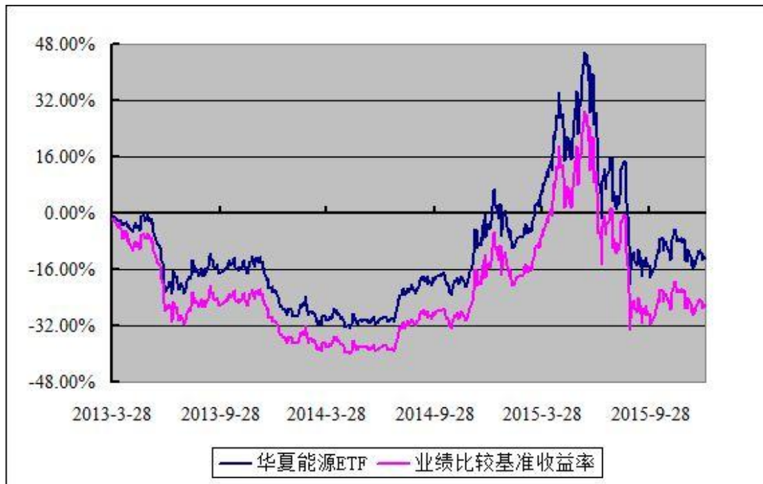
上证能源交易型开放式指数发起式证券投资基金 份额累计净值增长率与业绩比较基准收益率历史走势对比图 （2013年3月28日至2015年12月31日）