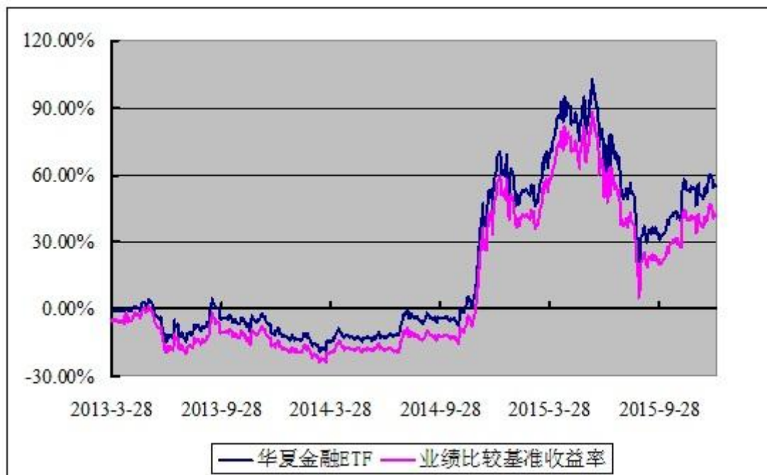
上证金融地产交易型开放式指数发起式证券投资基金 份额累计净值增长率与业绩比较基准收益率历史走势对比图 （2013年3月28日至2015年12月31日）