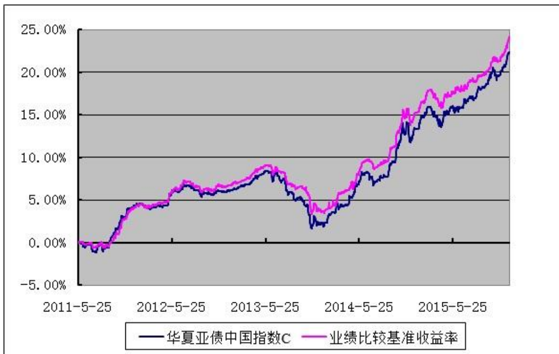
3.2.3 自基金合同生效以来基金每年净值增长率及其与同期业绩比较基准收益率的比较