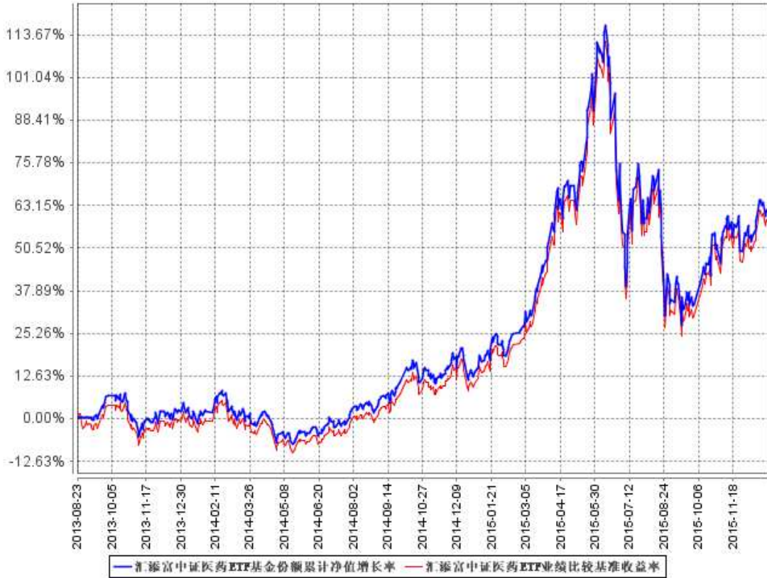
汇添富中证医药ETF基金份额累计净值增长率与同期业绩比较基准收益率的历史走势对比图

注：本基金建仓期为本《基金合同》生效之日（2013年8月23日）起3个月，建仓期结束时各项资产配置比例符合合同约定。