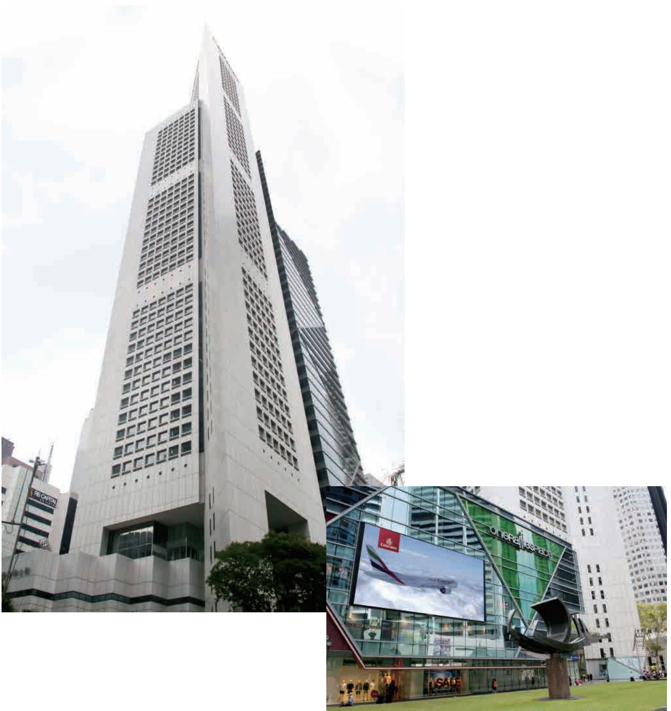
新加坡三大高樓之一——第壹萊佛士坊的LED