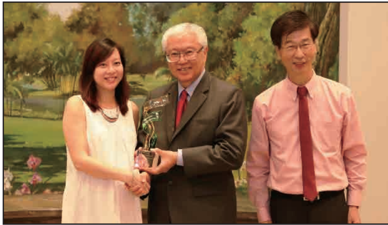
2. 贊助妝藝大遊行2015(新加坡)