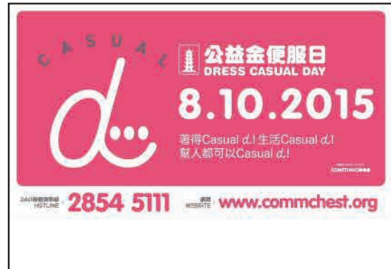
7. 贊助公益金便服日(香港)