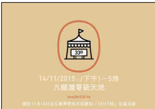
8. 贊助新生•身心靈(香港)