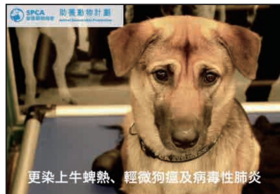
9. 贊助愛護動物協會零願計劃(香港)