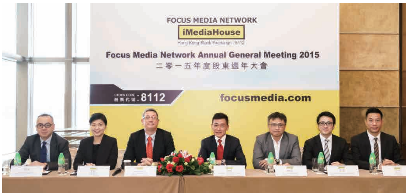
2015年5月股東週年大會