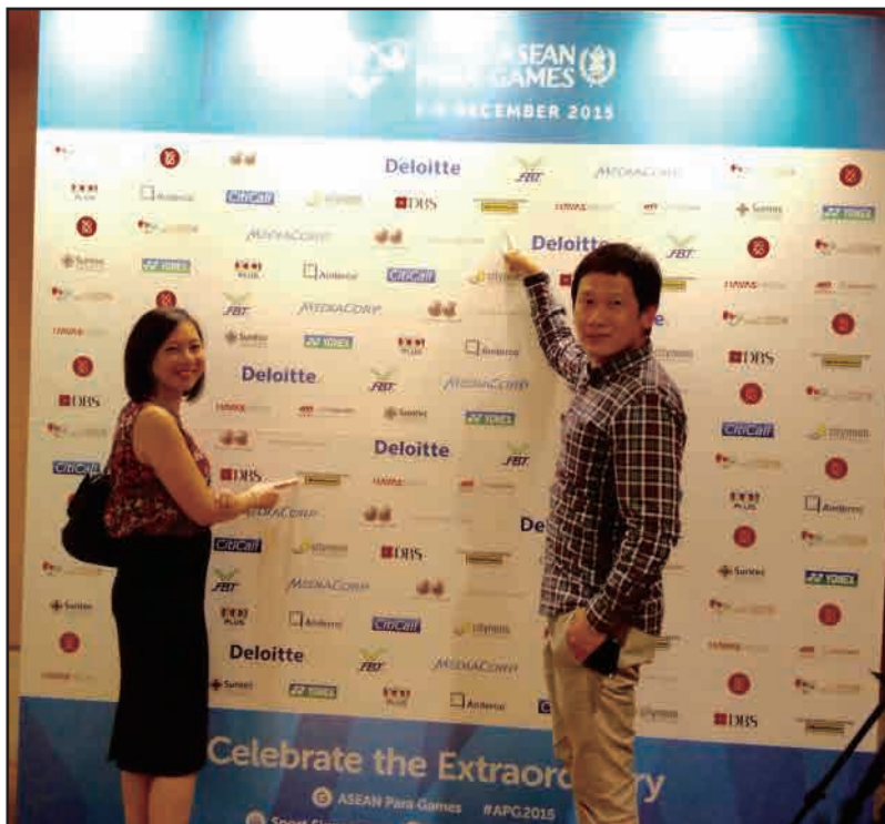
3. 贊助東協殘疾人運動會2015(新加坡)