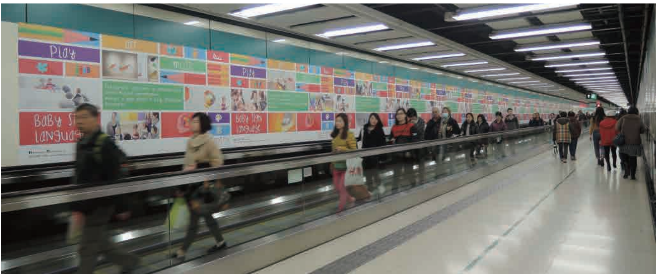
尖沙咀交匯處行人隧道及中間道行人隧道(共三條行人隧道)