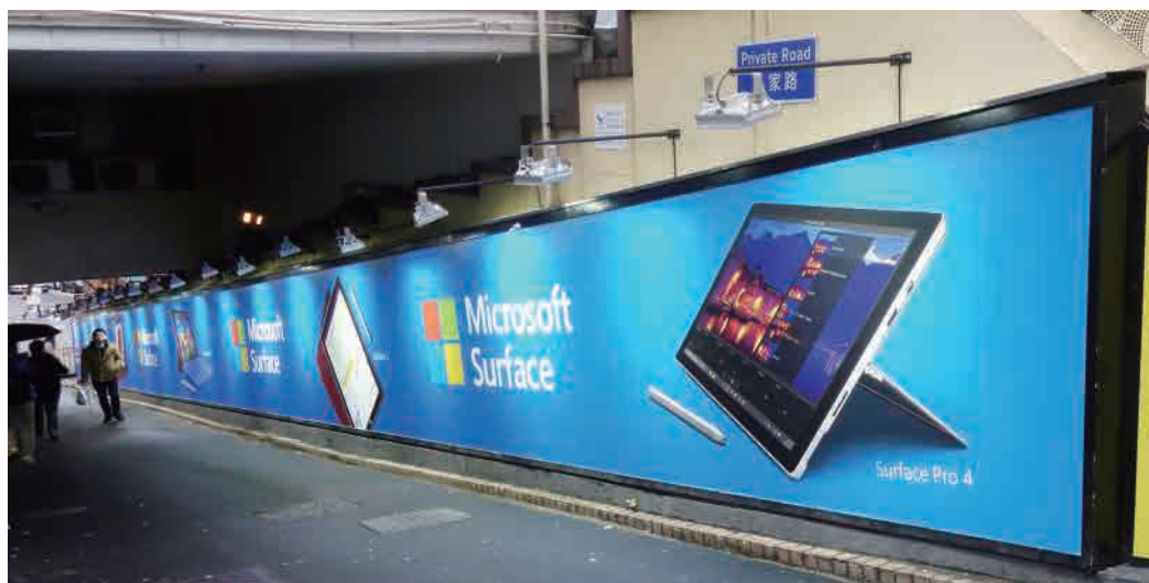
尖沙咀諾士佛臺廣告牌