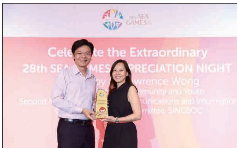
4. 贊助第28屆東南亞運動會2015(新加坡)