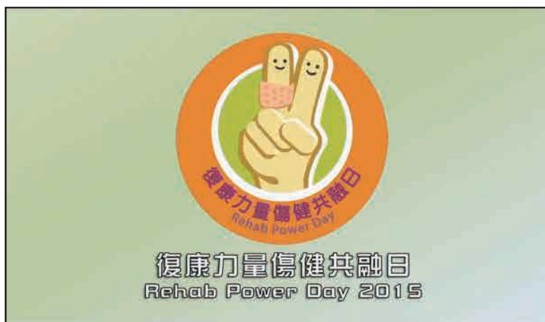
5. 贊助復康力量傷健共融日2015(香港)