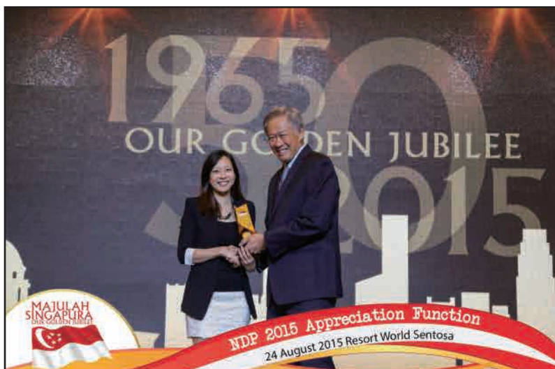
1. 贊助新加坡國慶慶典2015(新加坡)