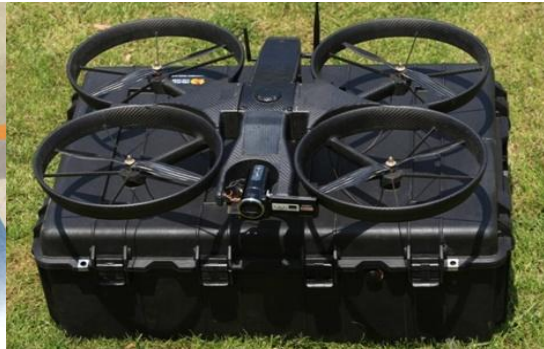
四旋翼反恐侦查无人机