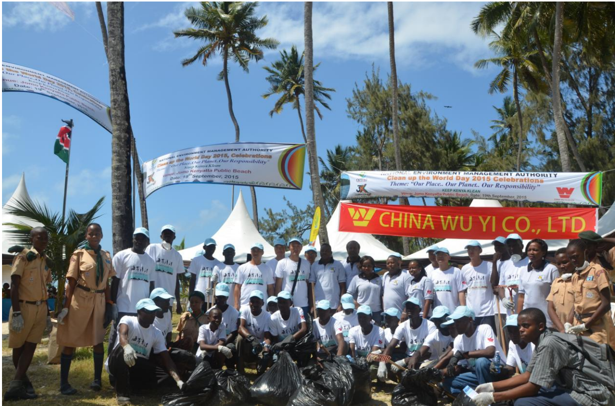
中国武夷肯尼亚公司组织志愿者们参加海洋垃圾清除活动

南苏丹公司积极帮助中国政府维和部队建设营区，受到济南军区维和事务办公室的高度赞扬，并授予公司“军民双拥非洲大地，携手共铸世界和平”牌匾。