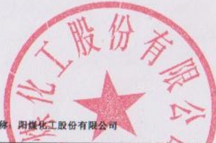
2015年度非经营性资金占用及其他关联资金往来情况汇总表