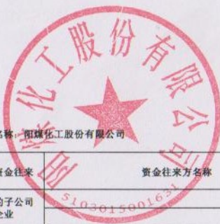
2015年度非经营性资金占用及其他关联资金往来情况汇总表