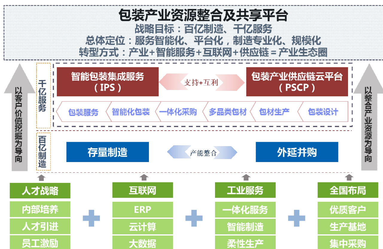
图：合兴包装战略规划示意图

2016 年，公司制定了打造“百亿制造、千亿服务的包装产业资源整合及共享平台”的战略目标，全面实行产业升级。公司计划未来 3 年在提升现有产能利用率、加快整合并购实现百亿产值的基础上，重点实施智能包装集成服务（IPS）、包装产业供应链云平台（PSCP）项目。IPS 项目基于客户包装产线自动化升级，以客户价值挖掘和客户包装一体化解决方案为导向，提供整体包装服务。包装产业供应链云平台（PSCP）项目立足于包装产业整合、效率提升，以产业服务平台为导向，加强对包装产业链的整合。公司将从制造业向服务业、从内生增长向外延并购、从制造环节到上下游产业链延伸等多维度协同推进，构建包装产业平台战略（见下图）。2016 年公司将开展如下工作：