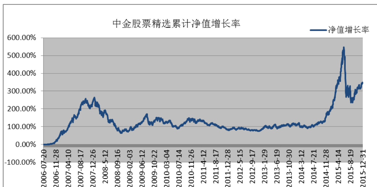
中金股票精选集合资产管理计划累计份额净值增长率历史走势图 (2006年7月20日至2015年12月31日)