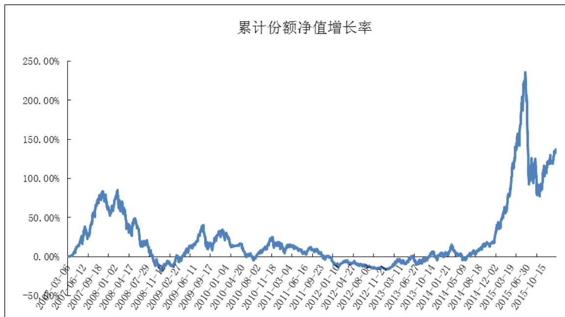
中金股票策略集合资产管理计划累计份额净值增长率历史走势图 (2007年3月6日至2015年12月31日)