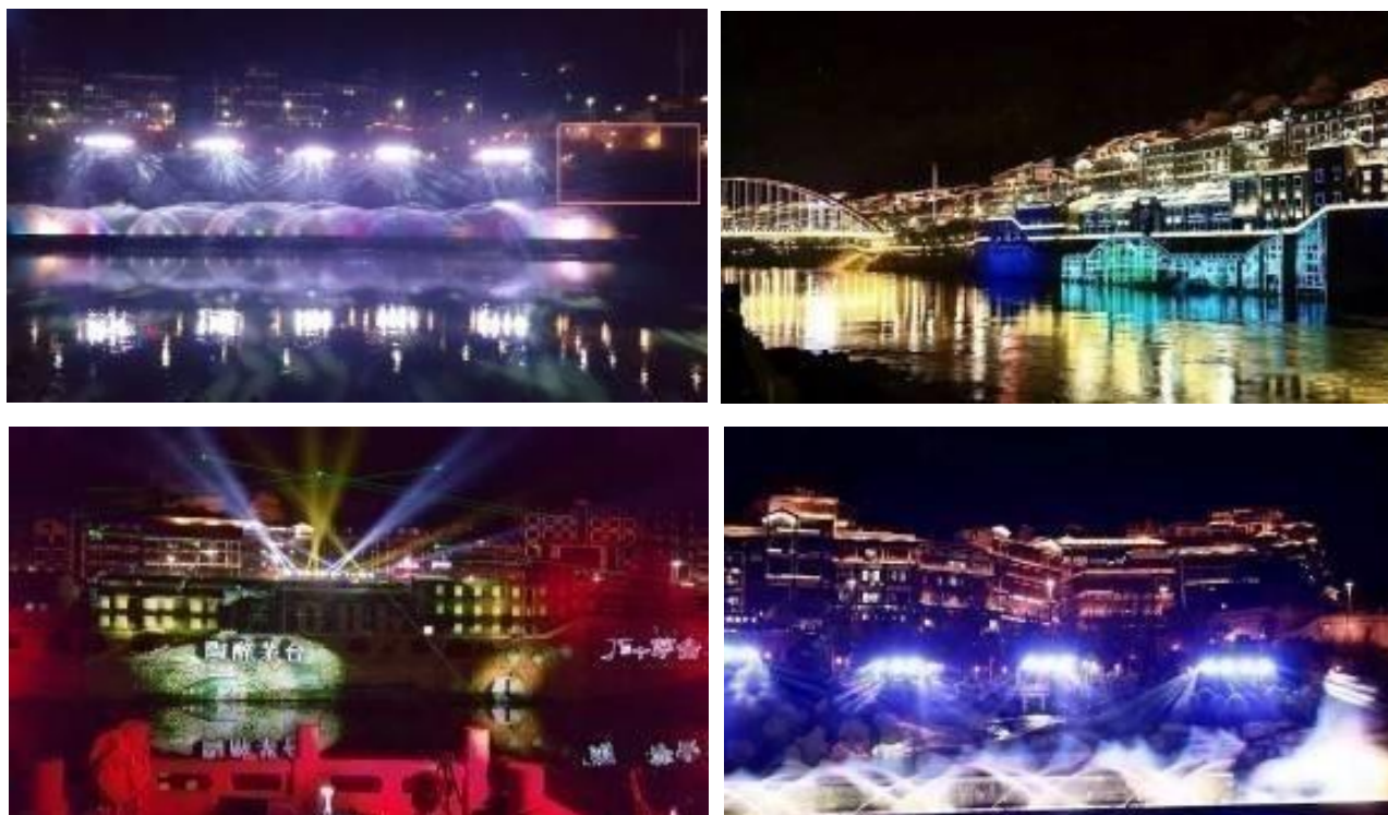
茅台镇照明亮化及水舞声光秀实景图

注：仁怀国酒文化演艺有限公司是由利亚德全资子公司利亚德投资，与仁怀市茅台镇文化旅游开发建设投资有限公司共同投资设立的，专门用于策划、实施和运营茅台镇演艺项目的公司，利亚德投资控股80%。