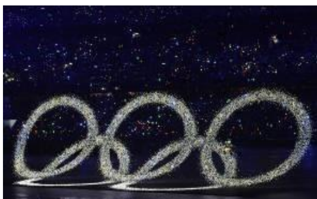
利亚德设计实施的“梦幻五环”

借助利亚德、励丰文化、金立翔在2008北京奥运会开闭幕式上，将视听科技与文化创意完美融合的成功案例，公司将集团内各子公司在视听文化领域的品牌优势，创意优势、产品技术优势、经验优势等进行资源整合，打造出新型的“城市文化、旅游、演艺”经营模式，根据各城市的文化旅游规划，为其城市文化旅游建设提供“视听文化解决方案”及文化演艺运营服务，与各城市政府合作共建“幸福城市”。