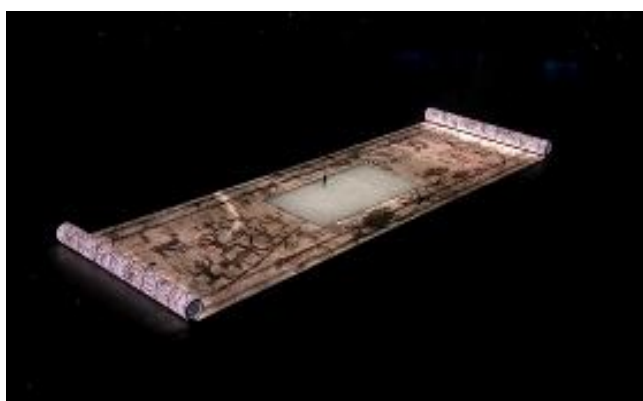
利亚德及金立翔设计实施的“画轴”