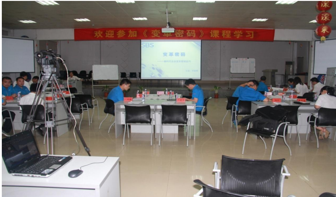
(变革密码课程培训)