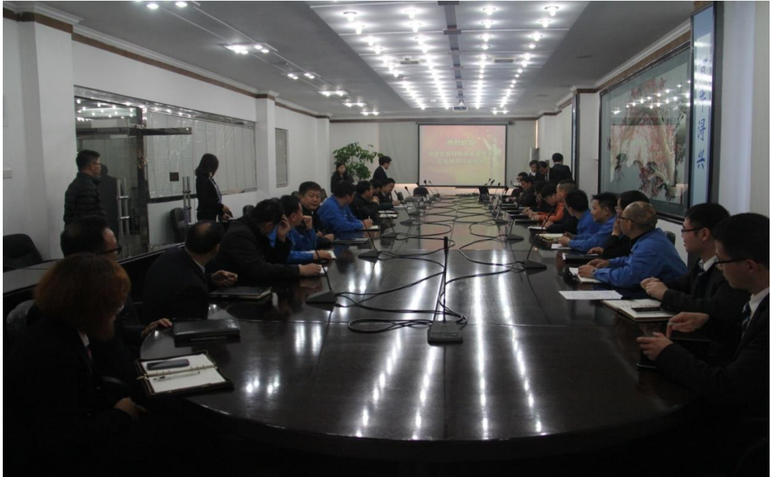
(安全生产标准化二级企业评审首次会议)