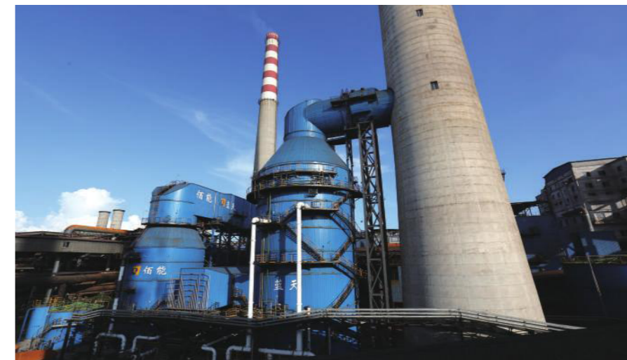
360m 2 烧结氨法脱硫系统

(5) 严格把好厂区危货车辆准入关，对危化品车辆规定行驶路线（临时准入车辆还规定行驶时间），安排路检人员日常进行重点监控，并督促和指导危化品运输单位规范车辆管理。