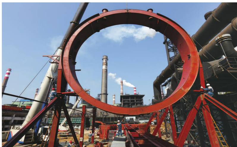
静电除尘器首座环梁吊装现场