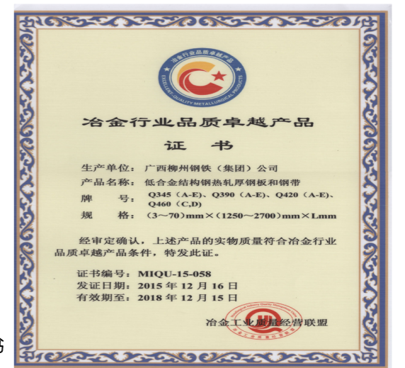
品质卓越产品证书