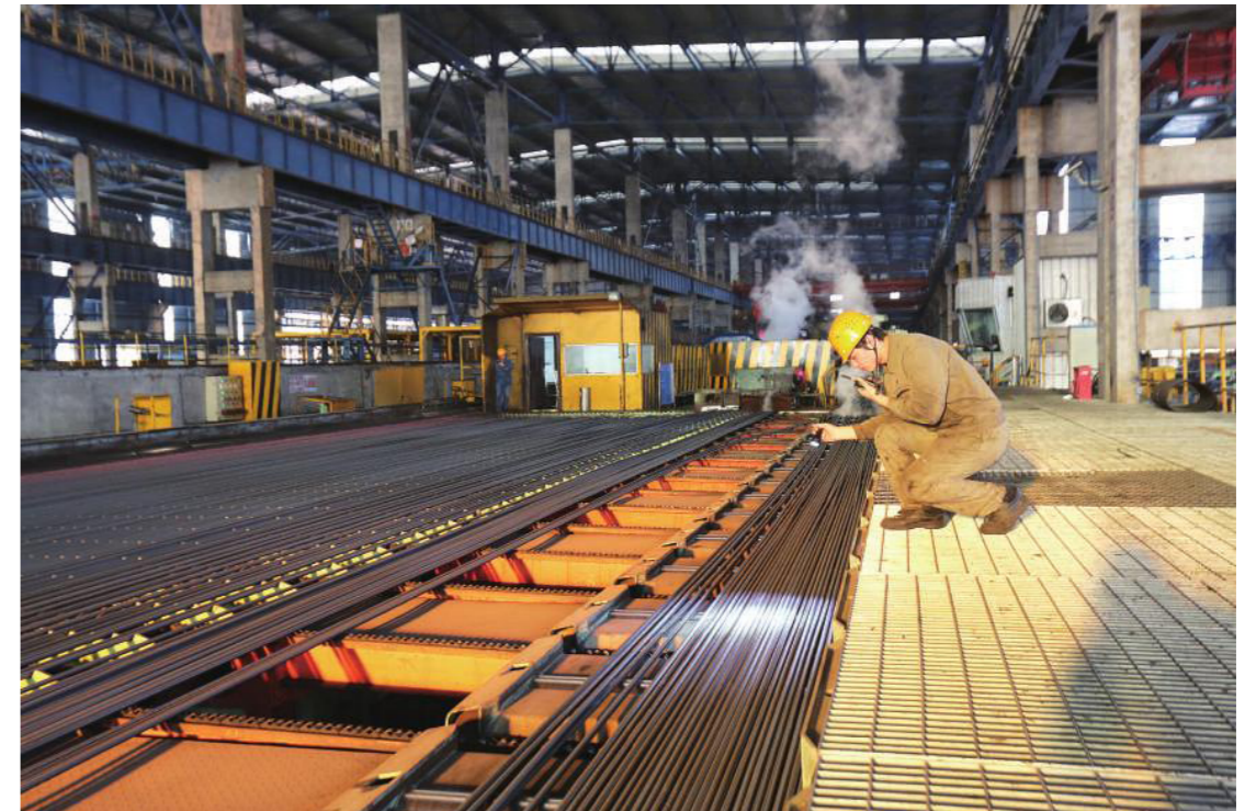
棒线材材厂工作人员检验成品螺纹钢表面质量