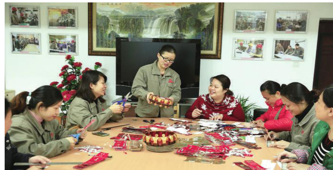
女职工制作“聚宝盆”义卖

人力资源是企业第一资源，是企业之本，公司坚持“人人皆是人才，人人皆可成才”的人才理念；通过构建公平的竞争机制和科学的人才评价选拔机制，形成“上岗靠竞争、竞争凭业绩”的良好氛围，促进优秀人才脱颖而出和快速成长；通过不断完善经营管理人才、专业技术人才和技能人才的职业发展通道，形成纵向、横向的人才成长模式，为员工的成长和发展提供广阔的平台。