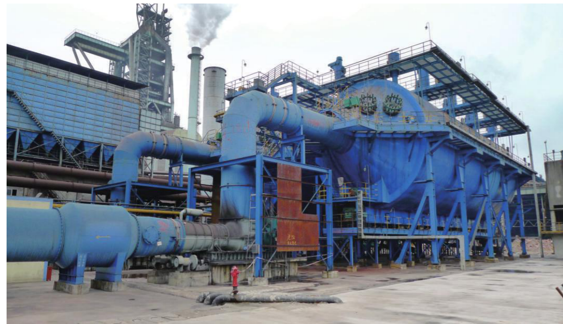
一次烟气干法除尘系统