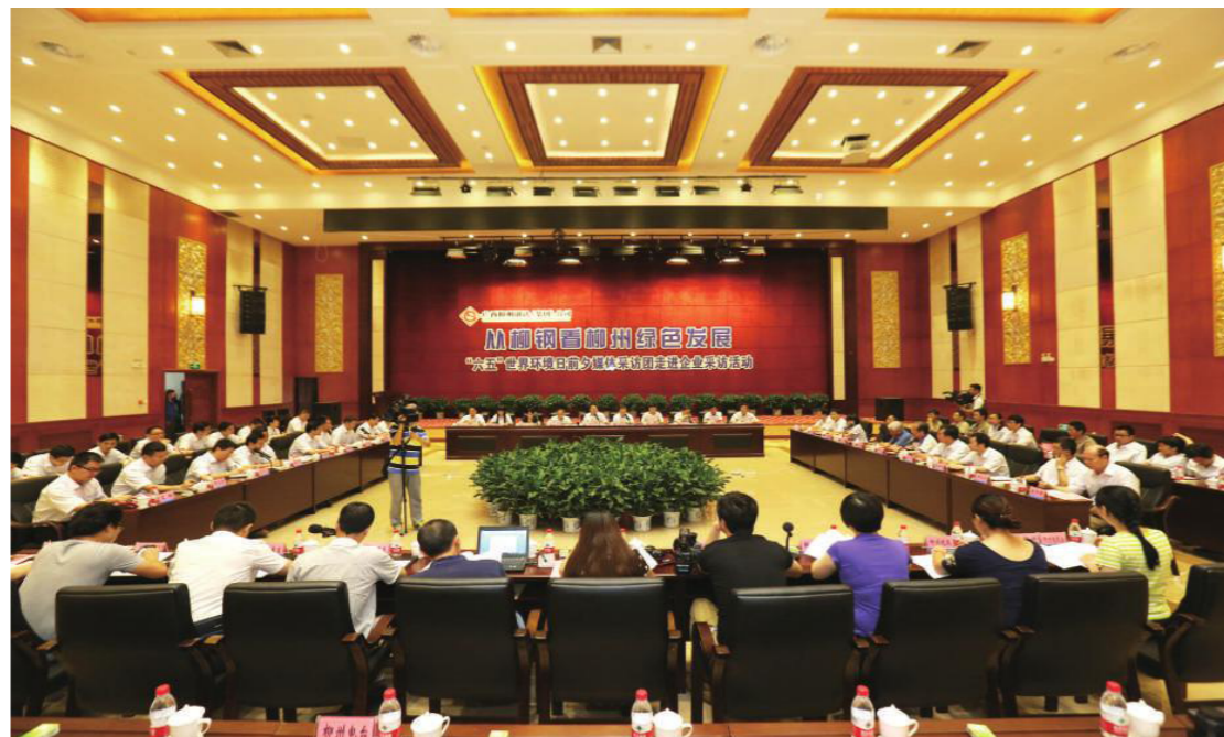
“六五”世界环境日，从柳钢看柳州绿色发展采访活动

在选派新一轮贫困村党组织第一书记工作座谈会上，公司明确新选派的第一书记要认清使命、珍惜机遇、不负重托，快速转变角色，沉下身子，放下架子，甩开膀子，充分发挥引领、示范、联络、桥梁作用，切实当好贫困村科学发展带头人，为加快广西贫困地区脱贫致富奔小康，全面建成小康社会添砖加瓦。