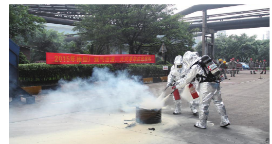
煤气泄漏、火灾事故应急演练活动