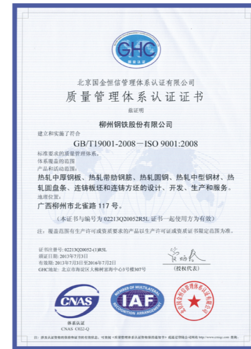
质量管理体系认证证书