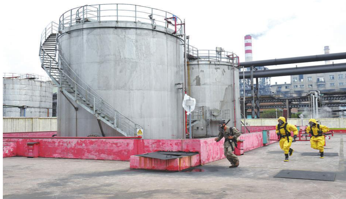
焦化厂举行油库储槽区 1 号粗苯槽粗苯泄漏着火事故的灭火、堵漏应急处置综合演练