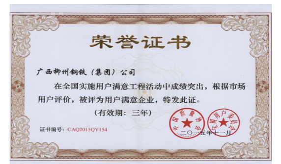
全国用户满意企业荣誉证书