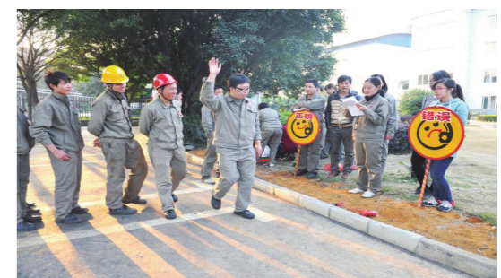
《安全生产法》拓展学习活动

（6）大力推动安全标准化单位创建、OHSMS 新版标准审核；加强宣传教育，加大安全培训力度，提高职工安全素质。