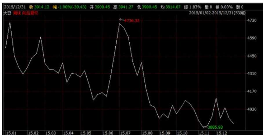
玉米、大豆商品指数走势图