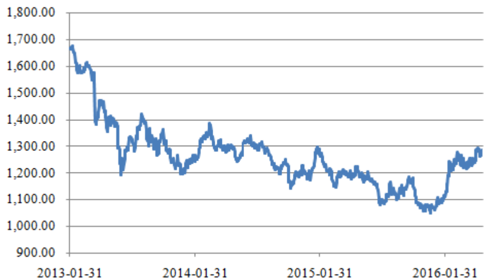
图 1 近年伦敦黄金市场现货黄金价格走势（单位：美元/盎司）

2015 年国际黄金价格整体呈下跌态势，削弱了黄金企业的盈利能力。以我国 A 股上市公司为例，2013-2015 年，紫金矿业集团股份有限公司（以下简称“紫金矿业”）、山东黄金矿业股份有限公司（以下简称“山东黄金”）的利润总额分别累计下降 45.60%、42.62%。