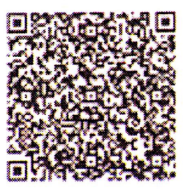
在线扫码获取详细信息

审查企业会计报表；出具审计报告；验证企业资本；出具验资报告；办理企业合并、分立、清算事宜中的审计业务；出具有关报告；基本建设年度财务决算审计；代理记账；会计咨询；税务咨询、管理咨询、会计培训；法律、法规规定的其他业务。（依法须经批准的项目，经相关部门批准后依批准的内容开展经营活动。）