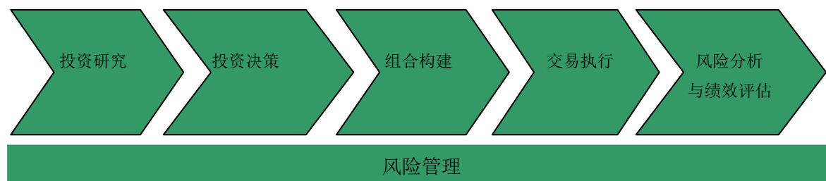
图 1 投资管理流程