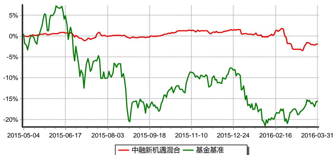
中融新机遇灵活配置混合型证券投资基金 累计净值增长率与同期业绩比较基准收益率历史走势对比图 (2015年05月04日至2016年03月31日)

注：按基金合同和招募说明书的约定，本基金自基金合同生效日起6个月内为建仓期，建仓期结束时本基金的各项投资比例符合基金合同的有关约定。