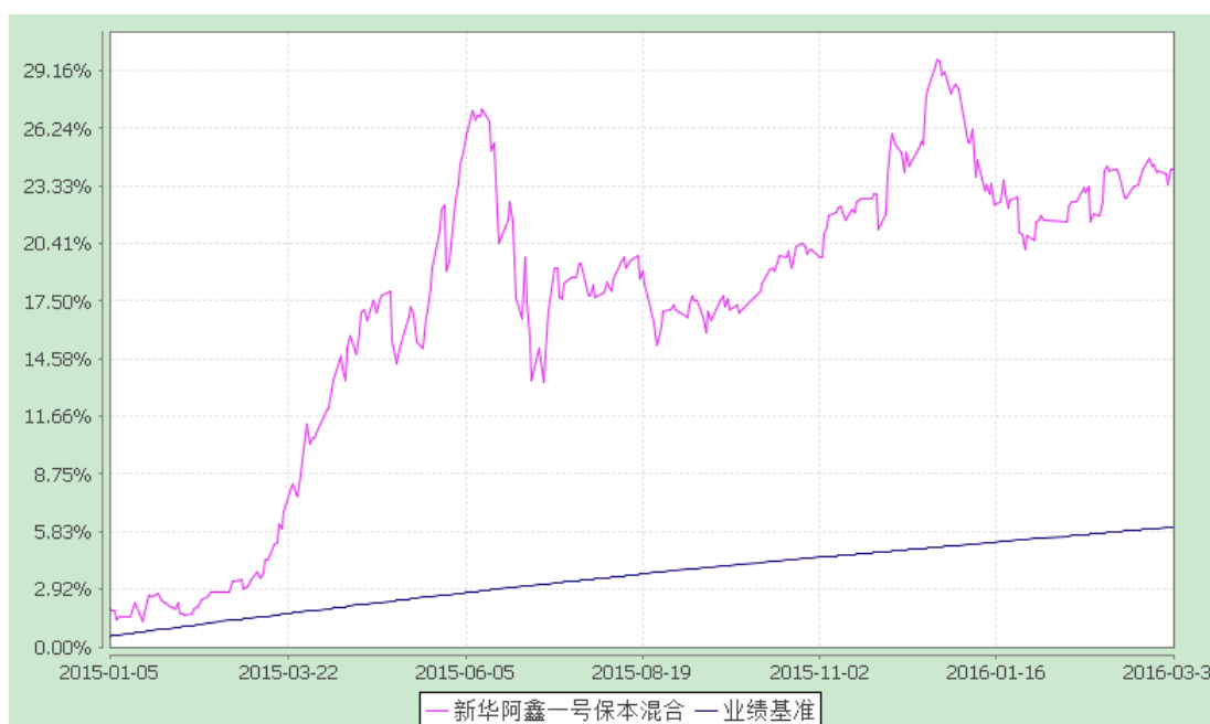
新华阿鑫一号保本混合型证券投资基金 份额累计净值增长率与业绩比较基准收益率历史走势对比图 (2014年12月2日至2016年3月31日)

(二) 自基金合同生效以来基金累计份额净值增长率变动及其与同期业绩比较基准收益率变动的比较