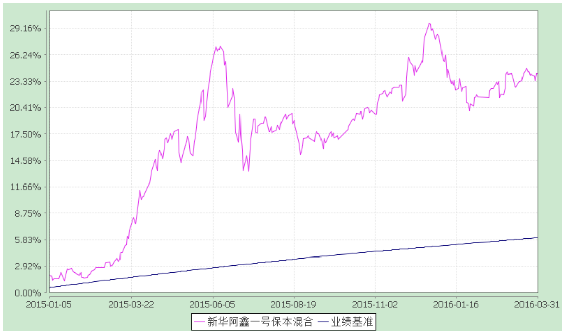
新华阿鑫一号保本混合型证券投资基金 份额累计净值增长率与业绩比较基准收益率历史走势对比图 (2014年12月2日至2016年3月31日)

(二)自基金合同生效以来基金累计份额净值增长率变动及其与同期业绩比较基准收益率变动的比较