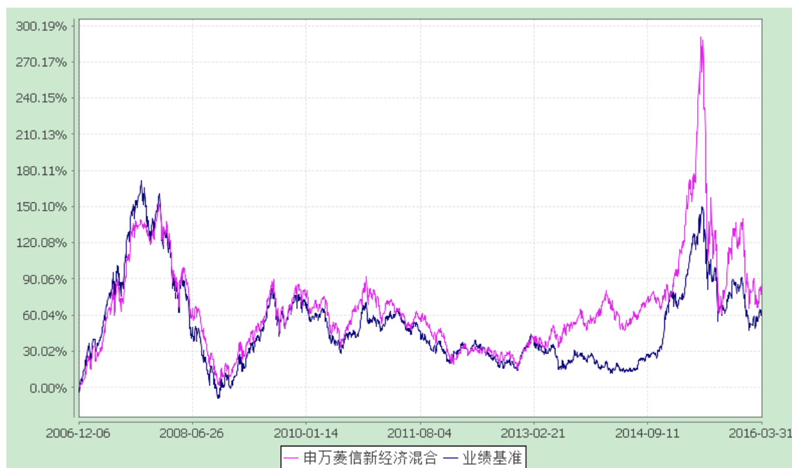
基金累计净值增长率与业绩比较基准收益率的历史走势对比

2. 自《基金合同》生效以来基金份额累计净值增长率与同期业绩比较基准的变动比较。