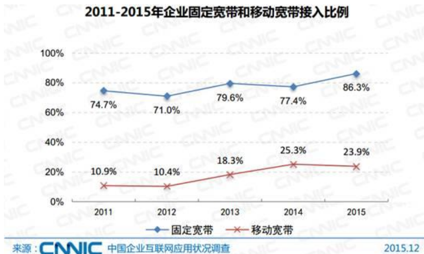
图4 2011-2015 年企业固定宽带和移动宽带接入比例

2015年12月，通过固定宽带接入方式使用互联网的企业比例为86.3%，移动宽带接入比例为23.9%。《“宽带中国”战略及实施方案》中“光进铜退”、“提速降费”、“宽带应用水平大幅提升，移动互联网广泛渗透”等工作目标的提出，持续夯实我国网络基础设施建设，使企业更广泛地接入互联网、更顺畅地使用互联网。但与此同时，与经济合作与发展组织成员国家2014年企业宽带普及率相比，中国企业的宽带接入水平仍然有一定差距：芬兰企业已实现100%宽带接入，韩国也高达99.0%。国内的企业宽带接入市场仍然有待发展。