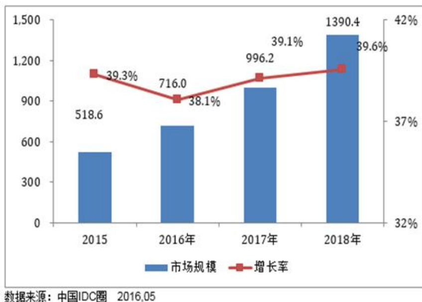
图3 2015-2018年中国IDC市场规模预测 (亿元)