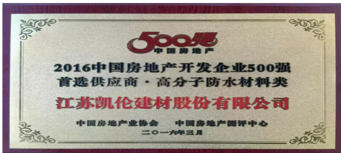
2016 年 3 月，凯伦建材获得由中国房地产业协会和中国房地产测评中心颁发的 2016 年中国房地产开发企业 500 强首选供应商，高分子防水材料类首选供应商证书。