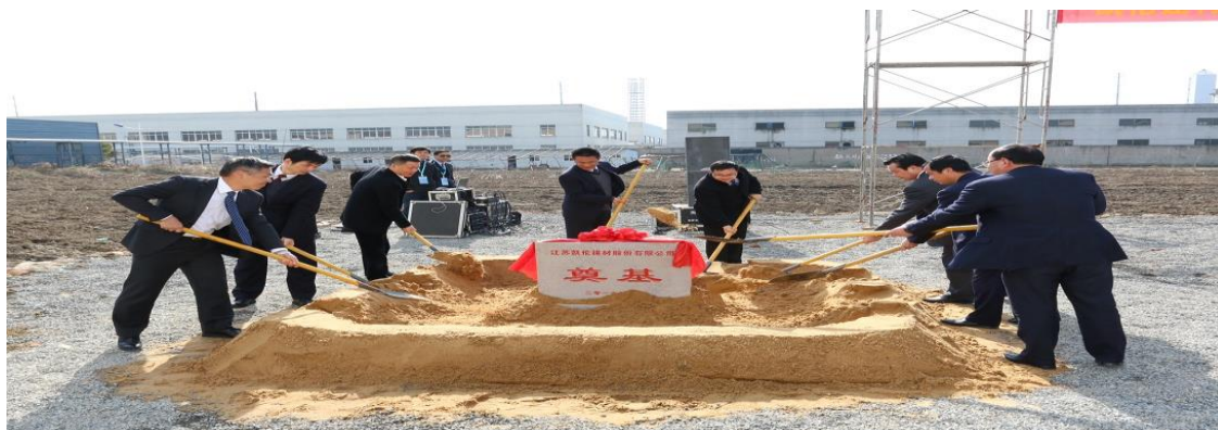
2016 年 2 月，凯伦建材新型高分子防水材料项目奠基启动仪式。