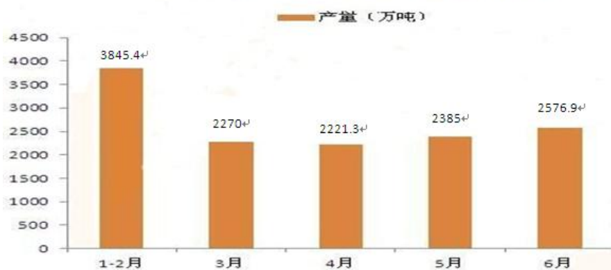
2016年1-6月中国饲料产量统计情况

2016年上半年，玉米、豆粕等饲料原料价格先跌后涨，波动幅度较大，传导至饲料产品销售端价格不断调整。但下游养殖行业逐步复苏，使2016年1-6月饲料产量仍呈温和上涨态势，总产量达13,298.6万吨，同比涨幅5.8%。