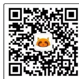
寓悦家居微信公众号