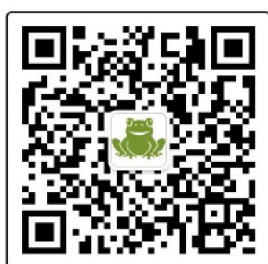
mwh曼好家微信公众号