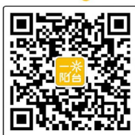
一米阳台微信公众号