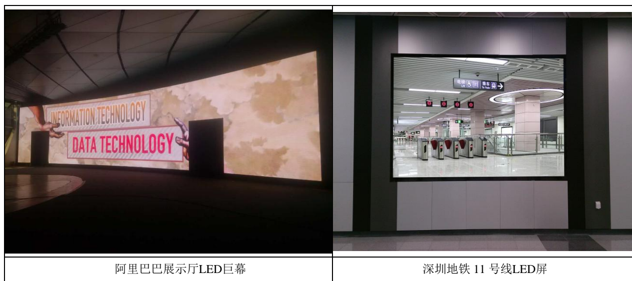
阿里巴巴展示厅LED巨幕

2016 年 6 月，深圳地铁 11 号线在万众期待中拉开了神秘的帷幕，11 号线是国内一次建成线路最长、设计时速最高、跨海运行的城市轨道快线。遍布在 11 号线各个站点的 177 套画面美丽的LED电子显示屏由联建光电提供，安装于各个地铁站的进出闸机口、扶梯两侧、出入口等位置。