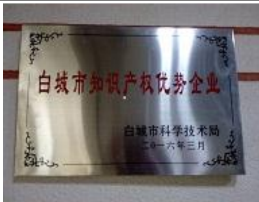
2016年3月 公司被白城市科技局授予“白城市知识产权优势企业”称号