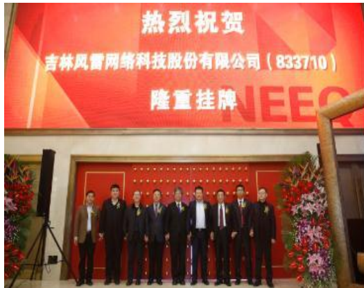
2016年1月4日 风雷网络新三板挂牌敲钟仪式在北京隆重举行