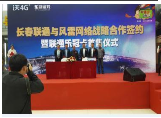
2016年5月16日 风雷网络与长春联通战略合作签约暨联通乐冠卡首售仪式