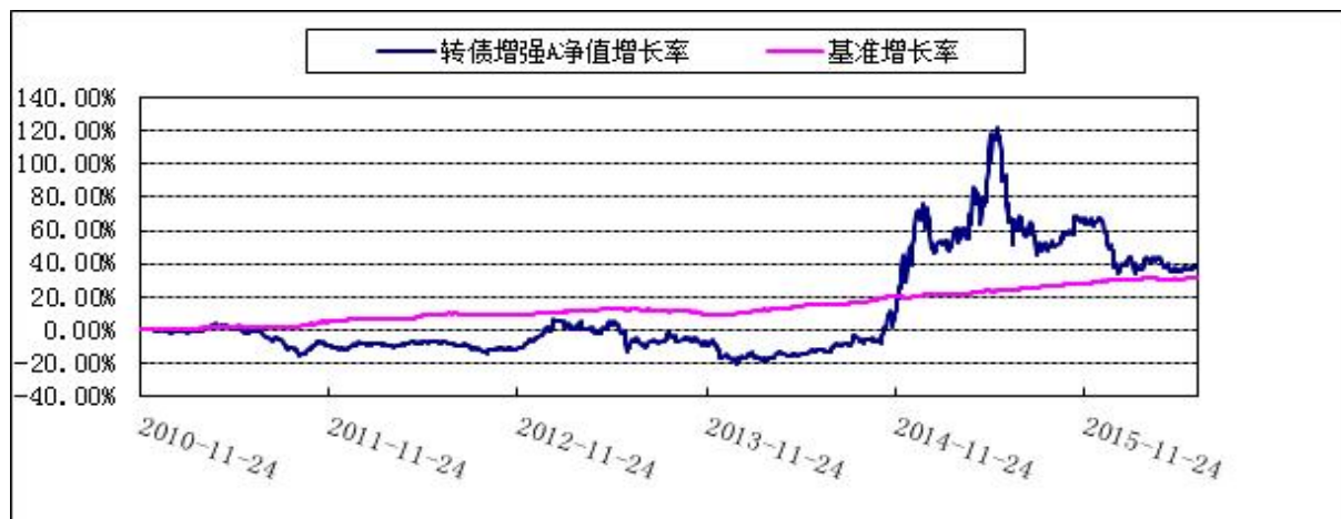
博时转债增强债券 C 类