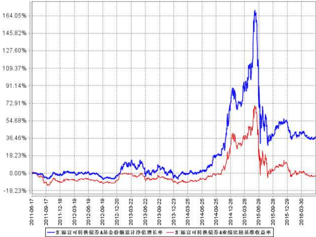
汇添富可转换债券A基金份额累计净值增长率与同期业绩比较基准收益率的历史走势对比图