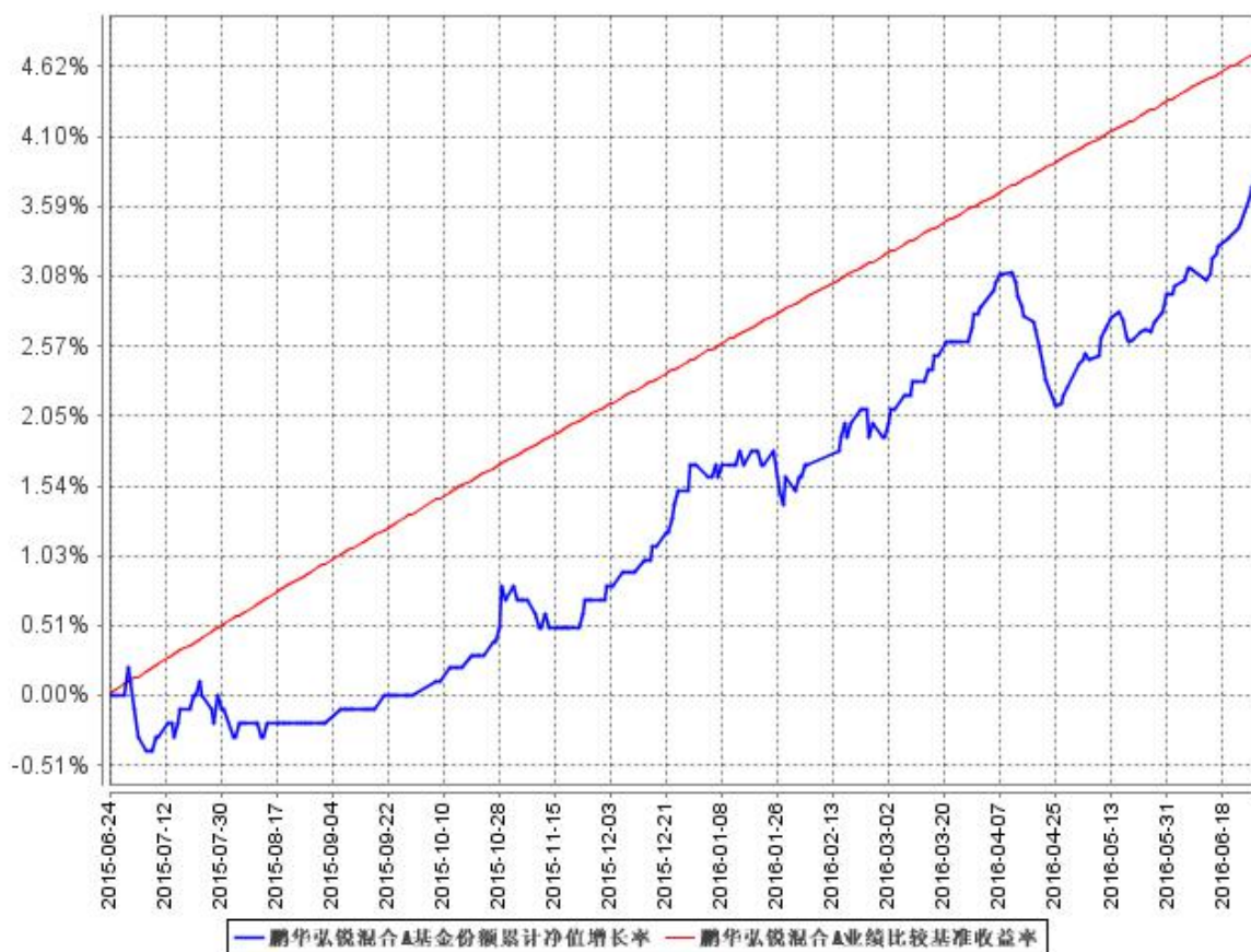
鹏华弘锐混合A基金份额累计净值增长率与同期业绩比较基准收益率的历史走势对比图