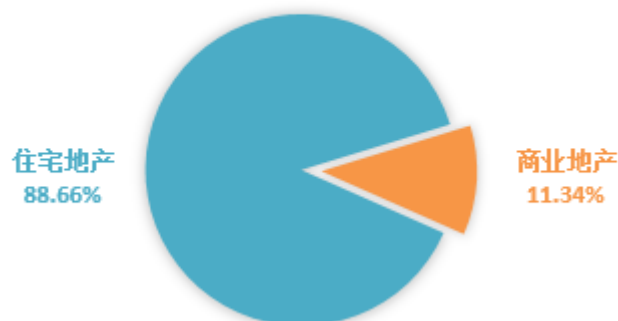
房地产开发业务分产品

报告期内，公司房地产开发业务分部实现营业收入52.71亿元，同比增长39.92%；实现净利润5.1亿元，同比增长62.38%。