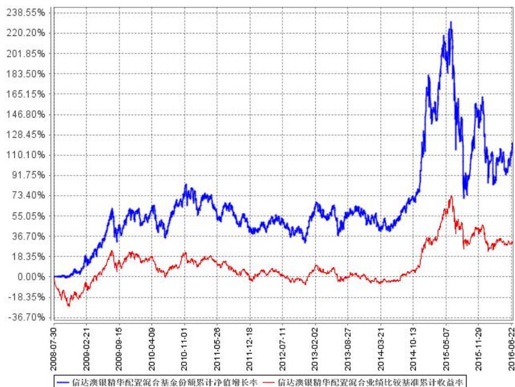
信达澳银精华配置混合基金份额累计净值增长率与同期业绩比较基准收益率的历史走势对比图

注：1、本基金合同于2008年7月30日生效，2008年8月29日开始办理申购、赎回业务。