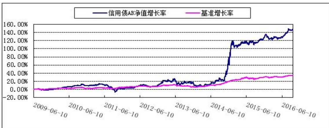
2. 博时信用债券 C: