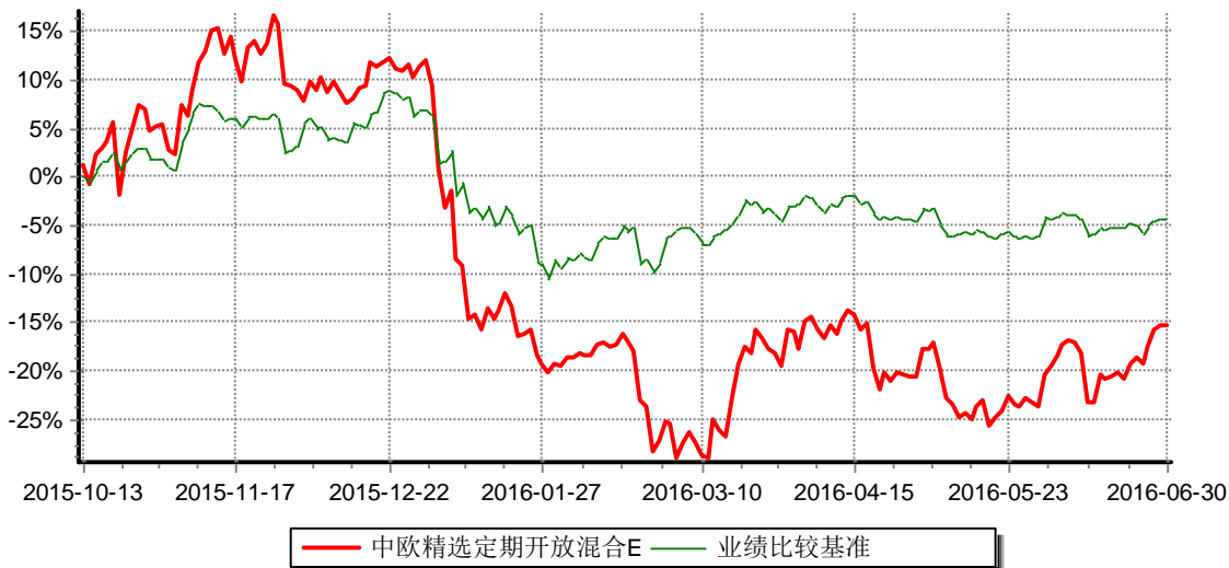
中欧精选定期开放混合E 基金累计净值增长率与业绩比较基准收益率历史走势对比图 (2015年10月13日-2016年6月30日)

注：自2015年9月22日起，本基金增加E类份额。图示日期为2015年10月13日至2016年6月30日。