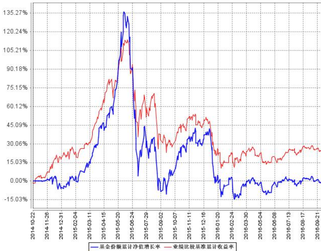
基金份额累计净值增长率与同期业绩比较基准收益率的历史走势对比图