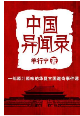
《中国异闻录》 (羊行中著)