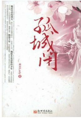
《孤城闭》 (米兰 lady 著)