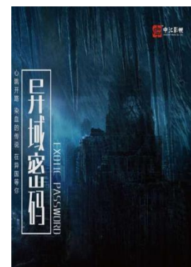
《异域密码》 (羊行中著)