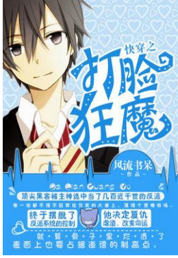
《快穿之打脸狂魔》 (风流书呆著)