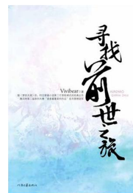
《寻找前世之旅》 (Vivibear 著)