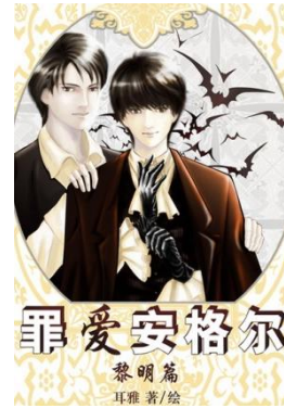
《罪爱安格尔》 (耳雅著)