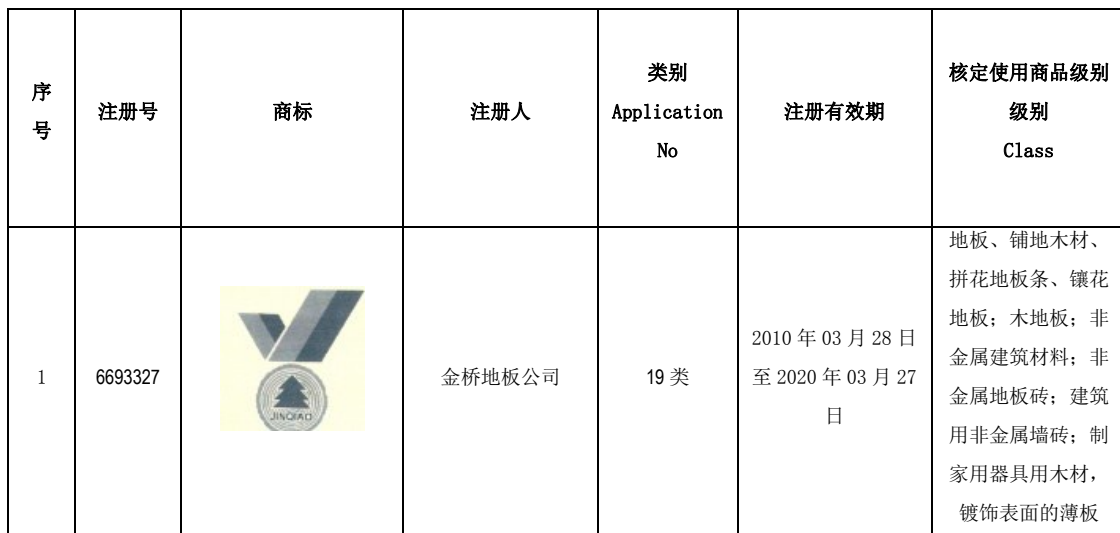
委估注册商标基本情况

本次评估范围内的商标资产为金桥地板公司在评估基准日的无形资产——“金桥”商标专用权。该注册商标为商品商标，其构成要素为文字及图形。本次委估的商标权共计1项为注册商标。评估基准日账面价值212,000,000.00元，具体情况详见下表：