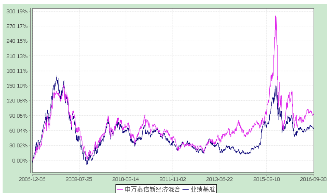
基金累计净值增长率与业绩比较基准收益率的历史走势对比

2. 自《基金合同》生效以来基金份额累计净值增长率与同期业绩比较基准的变动比较。