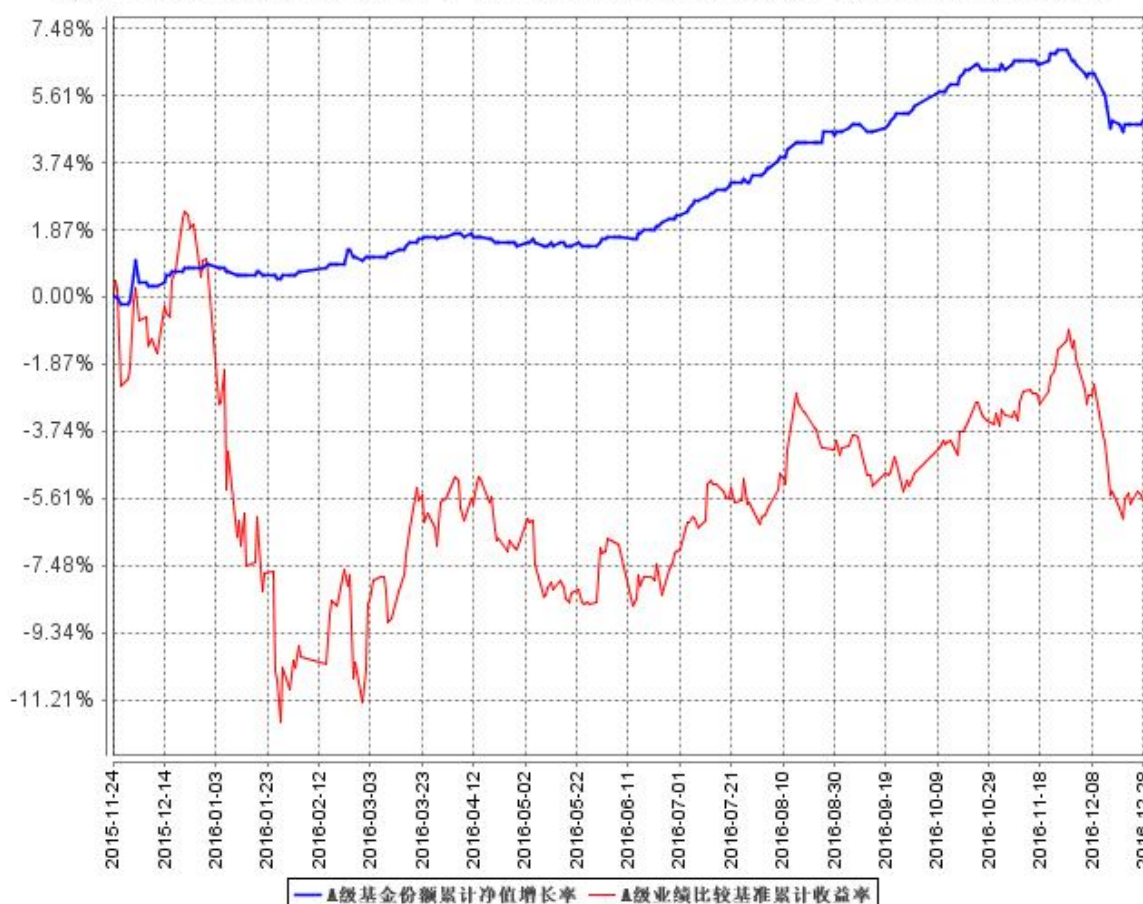
A级基金份额累计净值增长率与同期业绩比较基准收益率的历史走势对比图