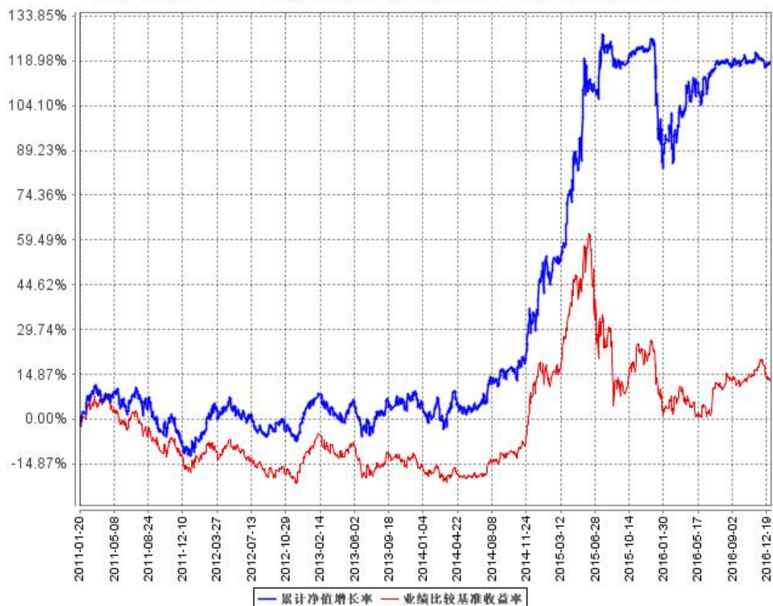
累计净值增长率与同期业绩比较基准收益率的历史走势对比图

2016年10月1日至2016年12月31日，本集合计划业绩比较基准“沪深300指数收益率*75%+上证国债指数收益率*25%”增长率为1.32%。