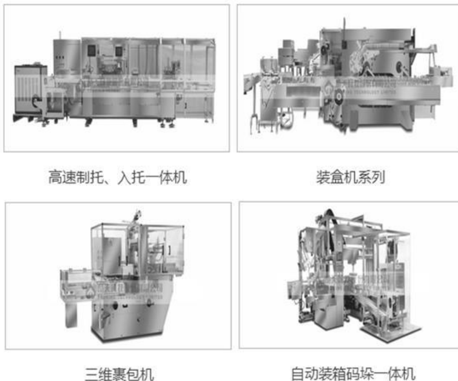
图：后包装工业机器人生产线系列

动化、高速化及智能化，为药品及食品工业的发展尤其是生物制药技术的应用及提高基本药物的质量提供良好的设备支持。