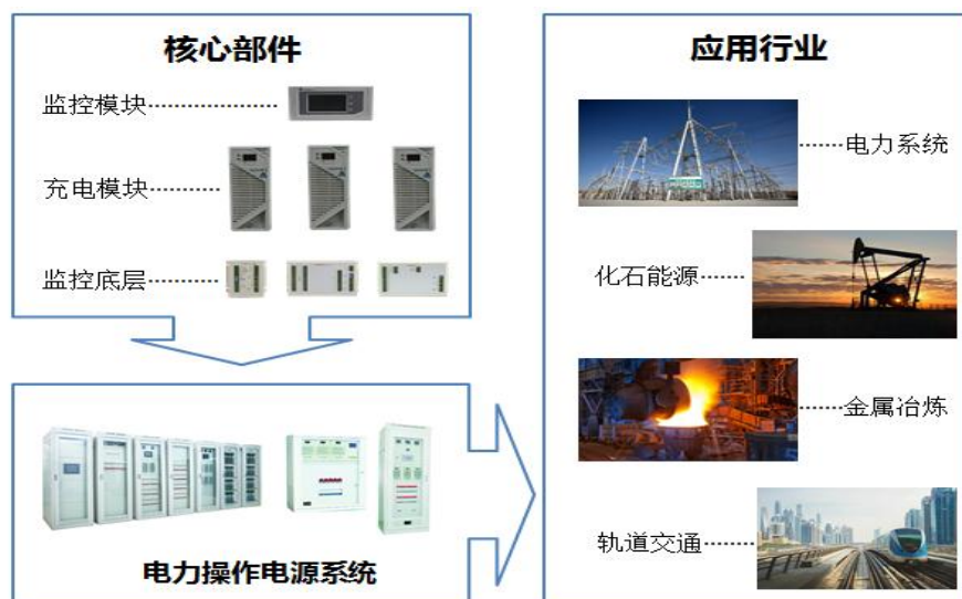
图2 电力操作电源产品核心部件及应用行业

电力操作电源系统是指为发电厂、变电站的电力自动化系统、高压断路器分合闸、继电保护装置、自动装置、信号装置、通信系统、遥控执行系统及事故照明等设备提供交流电源、直流电源、交流不间断电源的电力自动化电源设备，其可靠性、安全性直接影响到电力系统供电的可靠性和安全性。电力操作电源模块是电力操作电源系统的核心部件，主要包括充电模块、监控模块、通信模块、逆变模块等。