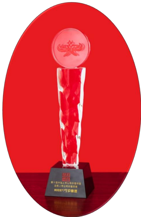
图 1：第十届中国上市公司价值评选 中国上市公司价值百强