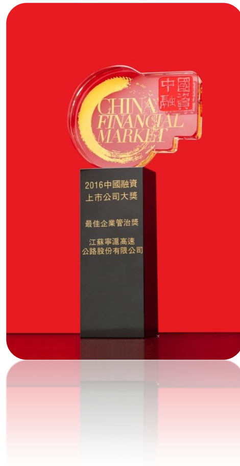
图 2：2016 中国融资上市大奖