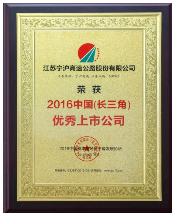
图三：2016 中国（长三角）优秀上市公司

在 2015-2016 年度公司信息披露考核中，获得全优的成绩；获得 2016 中国融资上市大奖、2016 中国长三角优秀上市公司、第十届中国上市公司价值百强等荣誉。